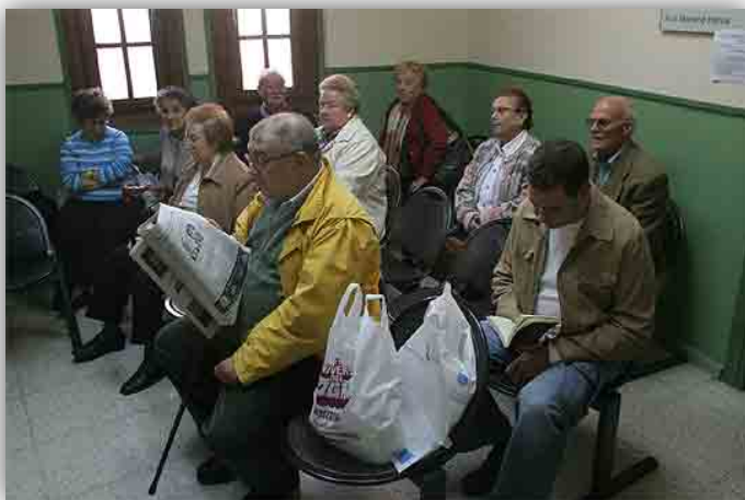
Sala de espera en un Centro de Salud en España, donde la mayoría son mayores de 65

Las personas mayores son además los mayores usuarios de la sanidad. Con más personas de la tercera edad, los gastos de este sector aumentan, pero con menos población activa, el aporte por los impuestos al dinero público disminuye.