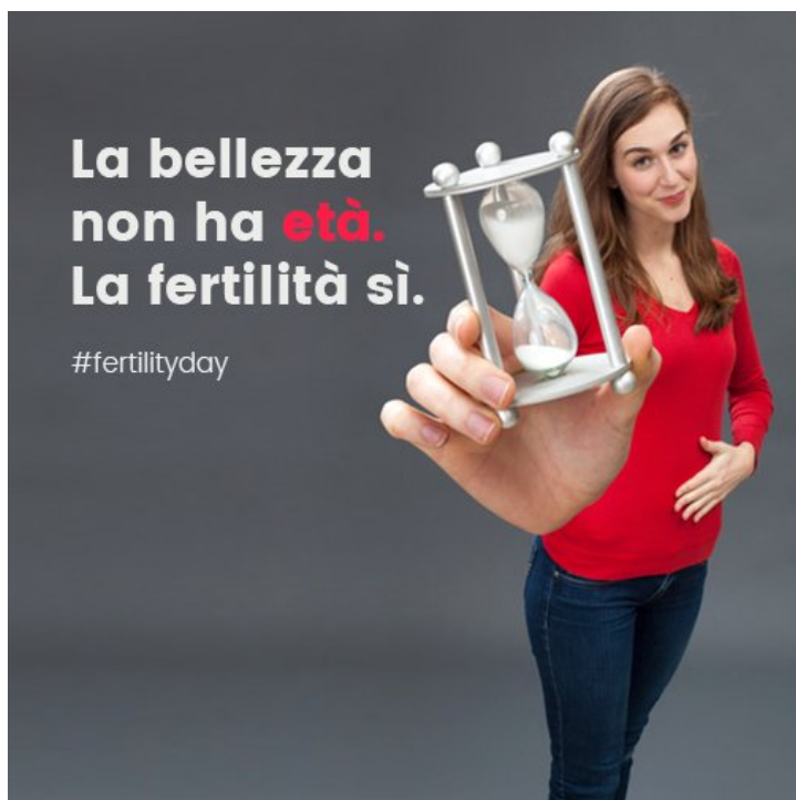
Ejemplo de campaña en Italia para la procreación en 2016

Otra manera de parar el envejecimiento poblacional es promover entre la población la necesidad de aumentar la tasa de natalidad. Francia, por ejemplo, tiene una de las tasas de fecundidad más altas de Europa (2,01) gracias a sus campañas de concienciación.